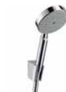
Optional: Raindance S 100 Air 1jet Handbrause/ Porter'S Brausehalter Set 1,25 m