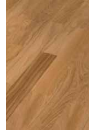
Mehrschichtstabparkett der Marke Hinterseer. PARAT Dos Eiche avant- gard lackiert 11mm

In den Wohnräumen ist ein Mehrschichtstabparkett der Marke Hinterseer geplant. Die Böden im Bad, WC und Technikraum werden mit Feinsteinzeug- Bodenfliesen belegt. Gemeinsam mit den Bauherren werden die exakten Materialien bemustert. Ein Budget von 50,00 Euro Brutto / m 2 ist in den Gesamtkosten enthalten. Mehrkosten werden zusätzlich berechnet.