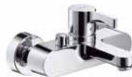
Metris S - Einhebel-Wannenmischer Aufputz