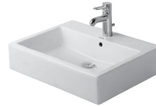
Duravit Vero WT