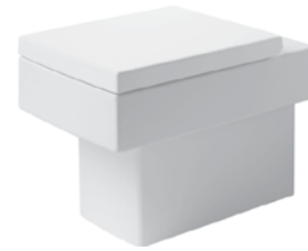
Duravit Vero WC