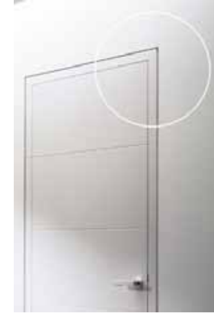
Wandbündige Stahlzarge mit Aufpreis.

Die Fenster werden als Holzfenster in der Farbe Anthrazit RAL 7016 ausgeführt. Die Hauseingangstür wird in einer Holzrahmenkonstruktion mit seitlichem Festteil mit Glasausschnitt gefertigt. Als Innentüren werden Holzumfassungszargen und Türblätter aus Röhrenspan mit Kunststoffbeschichtung in der Farbe Weiss RAL 9010 eingebaut. Die Einbauhöhe beträgt ca. 225 cm. Türen und Fenster erhalten Beschläge der Marke FSB Serie 1015 in Aluminium. Die gezeigten Abbildungen zeigen teilweise Sonderausstattung.