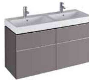
# 840522 - iCon Waschtischunterschrank