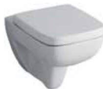
# 202150 - Renova Nr. 1 Plan Tiefspül-WC, kombiniert mit 572110