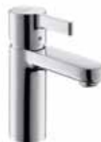
Metris S - Einhebel-Waschtischmischer mit Zugstangen-Ablaufgarnitur