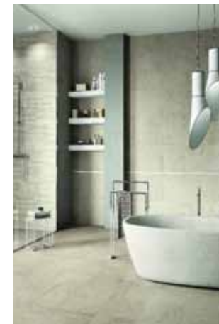
Feinsteinzeugfliese DOWNTOWN RETTIFICATO RI.PA von feinsteinzeugfliesen.com.de/

Die Oberflächen der Innenwände ab Erdgeschoss erhalten einen Gipsputz glatt gespachtelt sowie einen Silikat-Dispersionsanstrich in Weiss RAL 9010.