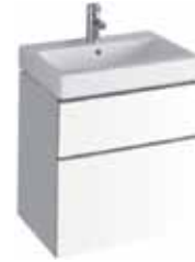
# 840360 - iCon Waschtischunterschrank