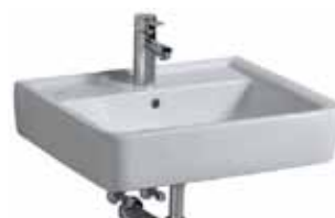
# 222260 - Renova Nr. 1 Plan Waschtisch