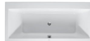
Duravit Vero Wanne