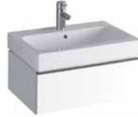
# 840260 - iCon Waschtischunterschrank