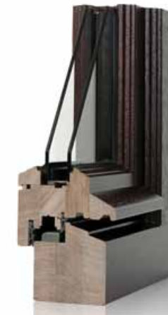
Holzfenster mit Isolierverglasung.

Die Fenster werden als Holzfenster in der Farbe Anthrazit RAL 7016 ausgeführt. Die Hauseingangstür wird in einer Holzrahmenkonstruktion mit seitlichem Festteil mit Glasausschnitt gefertigt. Als Innentüren werden Holzumfassungszargen und Türblätter aus Röhrenspan mit Kunststoffbeschichtung in der Farbe Weiss RAL 9010 eingebaut. Die Einbauhöhe beträgt ca. 225 cm. Türen und Fenster erhalten Beschläge der Marke FSB Serie 1015 in Aluminium. Die gezeigten Abbildungen zeigen teilweise Sonderausstattung.