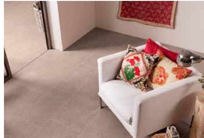
Feinsteinzeug- Bodenfliese: Steinoptik KLEVER SAND www.keope.com

Die hier gezeigten Abbildungen zeigen Möglichkeiten der Gestaltung.