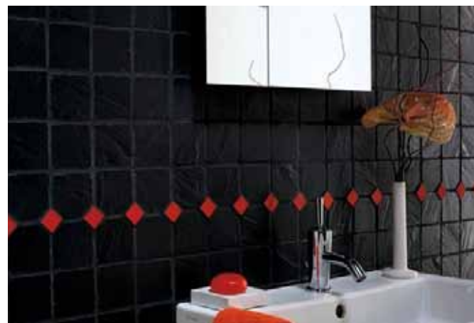
Feinsteinzeug-Wandfliese in Schieferoptik PIETRE NATIVE: LAVAGNA von Casalgrande Padana

Die Keramischen Wandbeläge werden gemeinsam mit den Bauherren bestimmt. Ein Budget von 50,00 € brutto/m 2 ist bereits im Gesamtpreis enthalten. Ein Mehrpreis wird zusätzlich berechnet. Die hier gezeigten Abbildungen zeigen Möglichkeiten der Gestaltung.