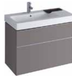
# 840392 - iCon Waschtischunterschrank 890 x 620 x 477 mm Korpus/Front: Platin Hochglanz, kombiniert mit Waschbecken 124190 (Abbildung) und 124195 linkes Waschbecken