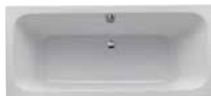
# 657380 - Renova Nr. 1 Badewanne 1800 x 800 mm Tiefe: 450 mm Nutzinhalt: 180 Liter Material: Sanitär-Acryl